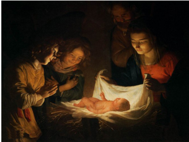
Thema: 'Het Licht zien...'