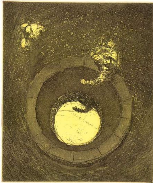
3e zondag van de 40-dagentijd

Zondag Oculi ('Mijn ogen zijn gevestigd')