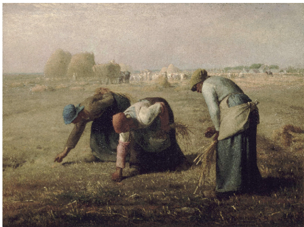
De arenleessters – J.F. Millet (1857)

Dienst met viering van het Heilig Avondmaal